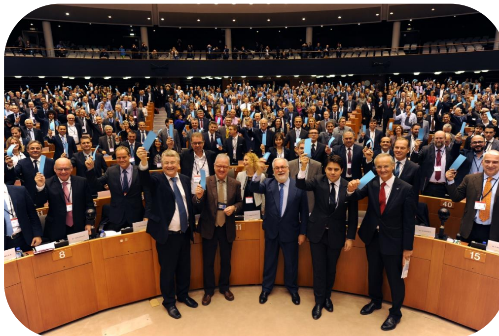
Parlamentul European, Ceremonia Convenției Primarilor 2015